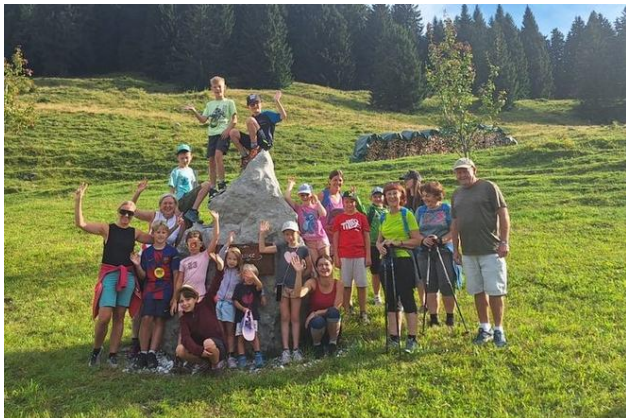
Gut gelaunt und voller Vorfreude: unsere Wandergruppe auf dem Weg zur Bergalm

Vom Wandertag im Sommer, über die bunte Kindersachenbörse im Herbst, bis hin zum Kinderturnen für unsere kleinen Wirbelwinde und dem Tanzkurs für alle Mädels im Alter von 6 bis 11 Jahren, war für jede Menge Spaß gesorgt.