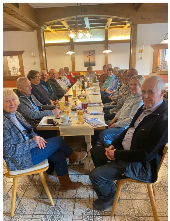
Text und Foto: Erika Aigner

Freitag, 13.02.2026...jeweils ab 14.00 Uhr beim SAGWIRT