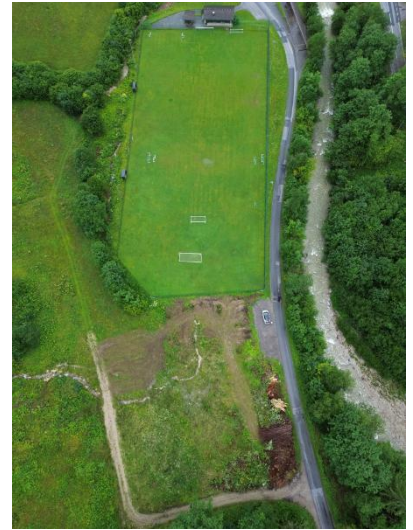
Text und Foto: Michael Sattler

Es gibt zahlreiche Vorschläge das Sportangebot durch z.B. Basketball, Tischtennis oder einem Bikepark zu erweitern. Auch die Neugestaltung vom Sportheim und dessen Mehrfachnutzung wird diskutiert. Derzeit arbeitet eine Gruppe an der Umsetzung dieser Anliegen. Als erstes Thema wird nun an der Realisierung vom Volleyballplatz gearbeitet. Wir planen bereits im Jahr 2026 erste Schritte und bitten die Gemeindegänger:innen, die Umsetzung dieser Vorhaben bestmöglich zu unterstützen.